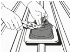
1. Rohrmanschette an Rohr anpassen