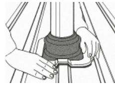
4. Rohrmanschette formgenau an Profilblech anpassen